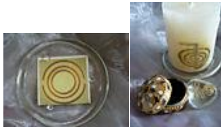
T-Zelle in Schmuckdose